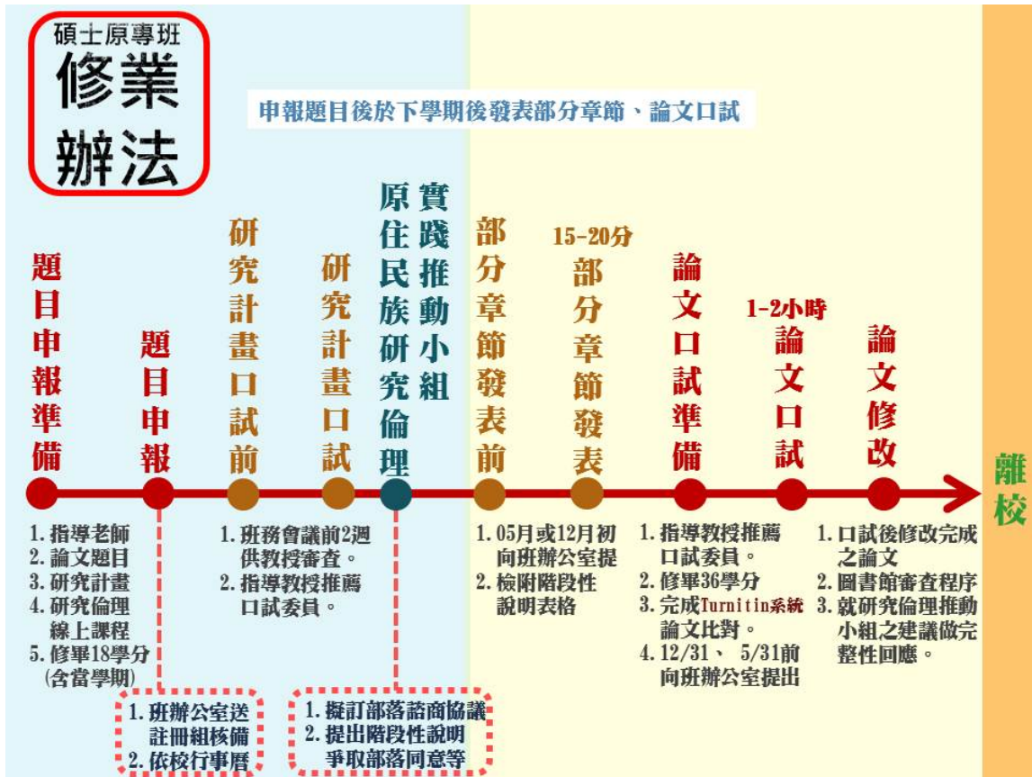
圖 2 土地政策與環境規劃碩士原住民專班修業辦法示意圖

本碩原專班於109年6月20日班務會議通過修業辦法草案，待原專班成立正式班務委員會後會再行修訂。在此謹依學位考試及取得辦法草案供參考：